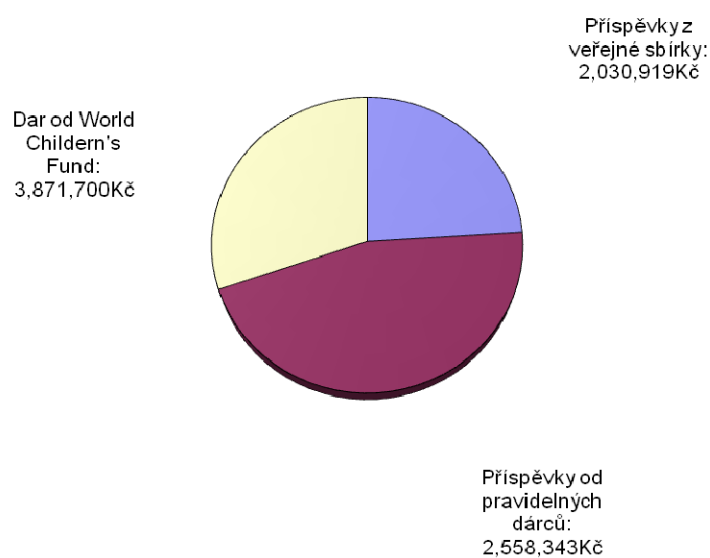
Přehled příjmů z roku 2007

Dále, dar ve výši 3 871 700 Kč poskytla World Children's Fund. Tato nadace zahájila počáteční fundraising v České republice, ale kvůli efektivitě byla v červenci 2007 nahrazena nadací NSFD.